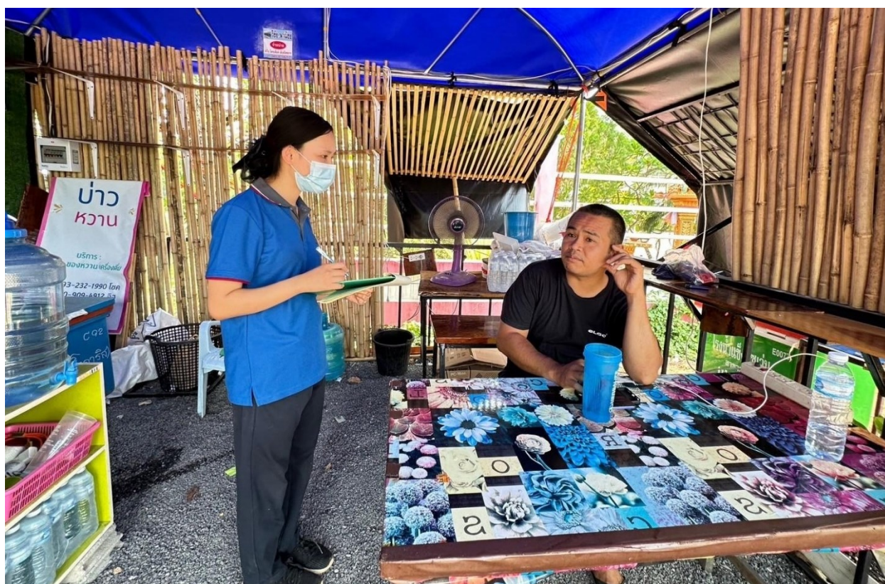
ภาพที่ ๓.๑ ทีมงานนักวิจัยลงพื้นที่แจกแบบสอบถามในเขตเทศบาลตำบลเพ็ญ อำเภอเพ็ญ (๑)

สุดท้าย ด้านการทำแบบสำรวจและประเมินความพึงพอใจในการให้บริการขององค์กรปกครองส่วนท้องถิ่น พบว่า กลุ่มตัวอย่างเคยทำแบบสอบถามประเมินความพึงพอใจการให้บริการขององค์กรปกครองส่วนท้องถิ่น ร้อยละ ๙๕ รายละเอียดตามตารางที่ ๔.๑