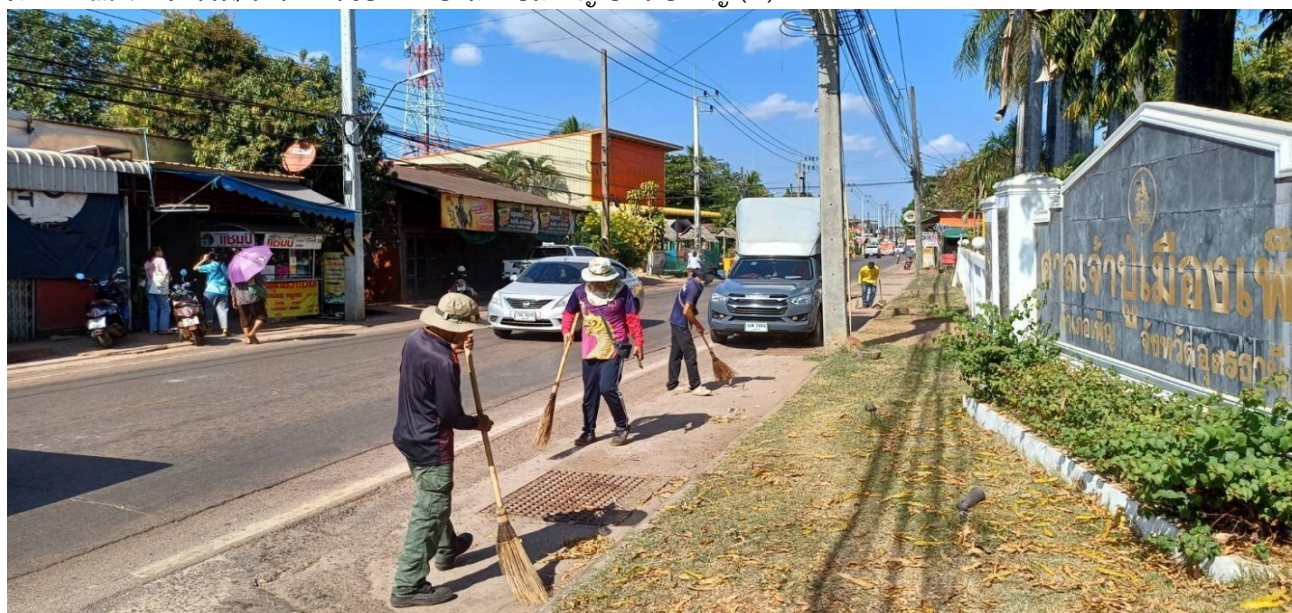
ภาพที่ ๓.๕ กิจกรรม/โครงการของเทศบาลตำบลเพ็ญ อำเภอพื๋อ (๗)

ผลการวิจัยพบว่า โดยเฉลี่ยผู้ตอบแบบสอบถามมีระดับความพึงพอใจงานด้านการรักษาความสะอาดในที่สาธารณะ ของเทศบาลตำบลเพ็ญ อำเภอพื๋อ จังหวัดอุดรธานี (ประจำปีงบประมาณ พ.ศ. ๒๕๖๗) ร้อยละ ๘๕.๖๕ โดยมีรายละเอียดดังนี้