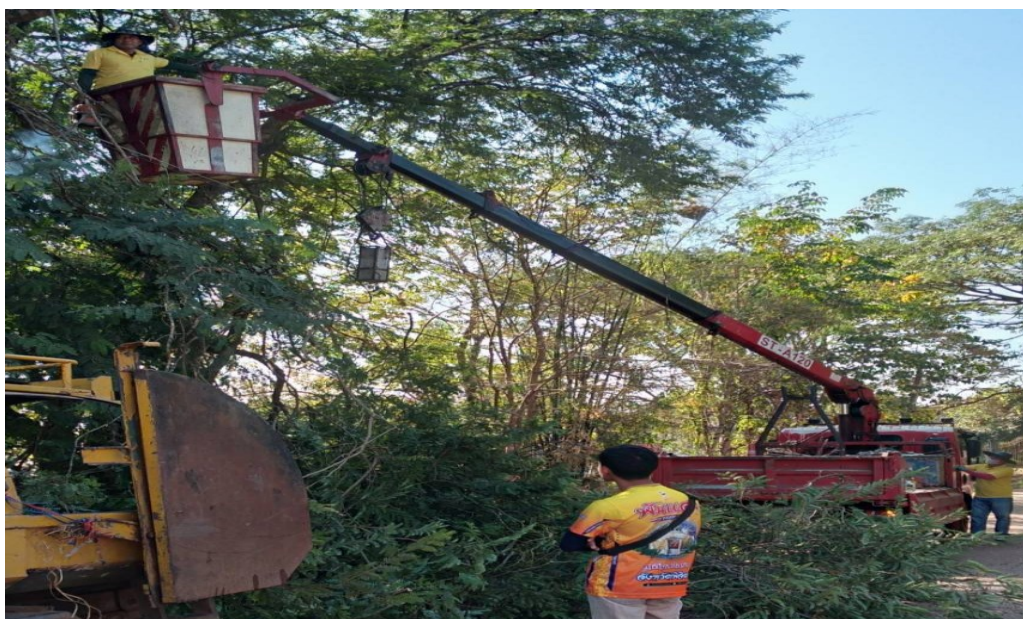
ภาพที่ ๓.๔ กิจกรรม/โครงการของเทศบาลตำบลเพ็ญ อำเภอเพ็ญ (๖)

ในด้านภาพรวมความพึงพอใจงานด้านโยธา การขออนุญาตปลูกสิ่งก่อสร้าง ของเทศบาลตำบลเพ็ญ อำเภอเพ็ญ จังหวัดอุดรธานี (ประจำปีงบประมาณ พ.ศ. ๒๕๖๗) พบว่า ประชาชนผู้รับบริการมีความพึงพอใจร้อยละ ๙๕.๖๗ (รายละเอียดดังตารางที่ ๔.๒)